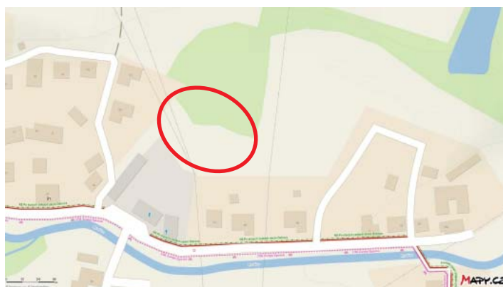
Řešené území na základní mapě